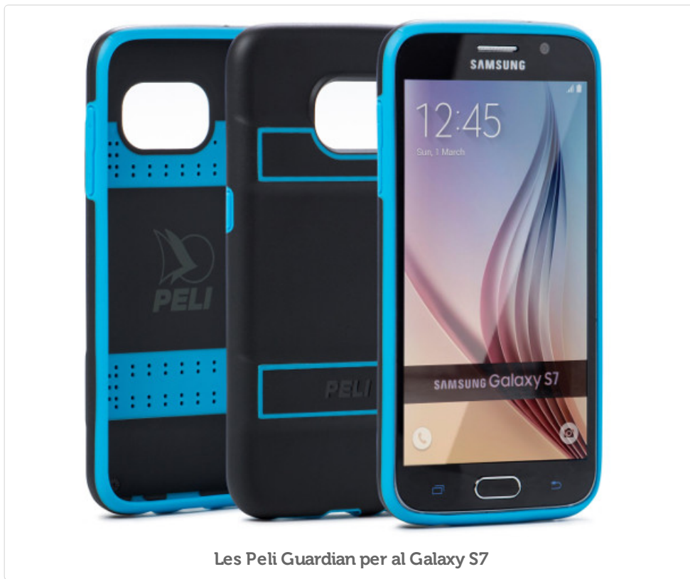
Les Peli Guardian per al Galaxy S7